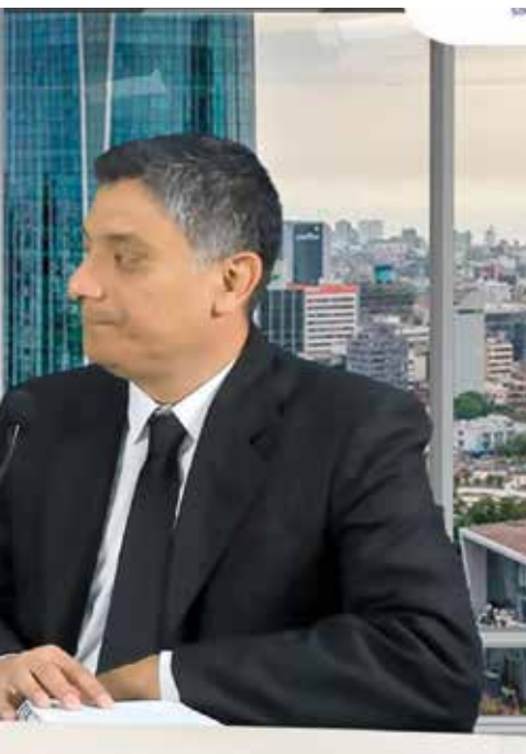
... por el lado de la industria metalmeccánica, no nece-