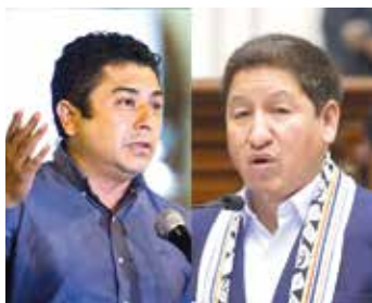
Guillermo Bermejo y Guido Bellido

El caso está a cargo del juez supremo Juan Carlos Checkley, en la etapa de investigación preparatoria, frente al pedido para incorporar a la Procuraduría como actor civil en el proceso. En el documento se lee que se ha configurado “un daño extrapatrimonial”.